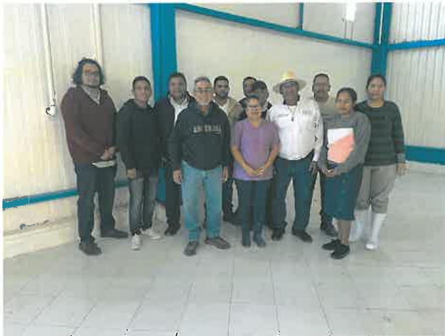
Personal de CREMES, después de conocer el Protocolo de Contingencia para Incendios y Huracanes aplicable en CAES y CREMES;